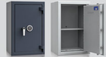
OS200434 / OS200435