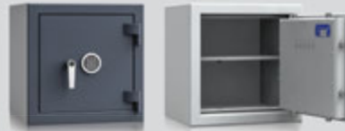
OS200430 / OS200431