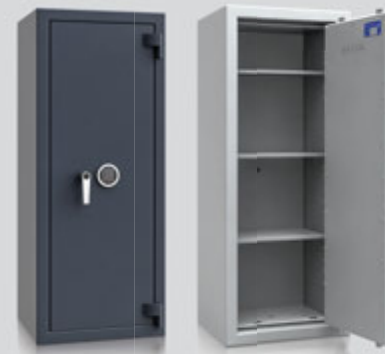
OS200440 / OS200441