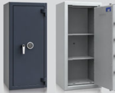
OS200438 / OS200439