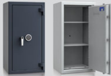
OS200436 / OS200437

Elektronisches Kombinationsschloss - Solar Basic