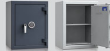
OS200432 / OS200433